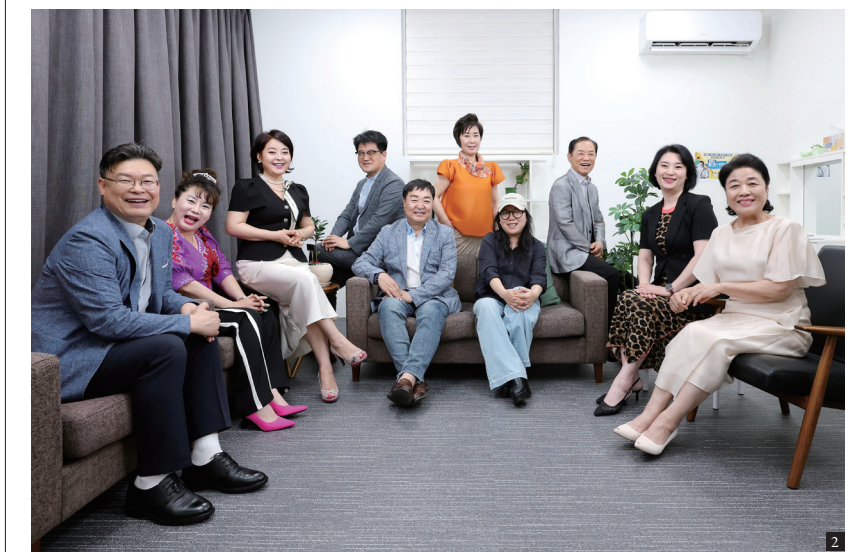
1. 한국시니어방송은 시니어세대를 위한 다양한 정보 프로그램을 비롯해 문화·교육·생활 분야의 폭넓은 콘텐츠를 선보이며 시니어맞춤형 미디어로 영역을 넓혀가고 있다. 2. 각자의 전문성과 경험을 갖춘 구성원들이 참여하며 한국시니어방송의 콘텐츠는 더욱 다채롭고 깊이 있는 이야기로 채워지고 있다.

한국시니어방송은 앞으로 시니어만을 위한 공간에만 머물 계획이 없습니다. 오히려 시니어의 경험과 청년의 감각이 만나 서로 배우고 성장하는 플랫폼을 지향하고 있습니다. 이를 위해 다양한 분야의 전문가들이 힘을 모으고 있습니다. 전 방송국 대표, 현직 교수진, PD, 작가, 아나운서, 가수, 배우 등 각자의 전문성을 가진 구성원들이 참여해 새로운 프로그램을 기획하고 있습니다. 현재는 어르신들이 AI와 디지털 기술을 보다 자유롭게 활용할 수 있도록 스마트폰 활용법, SNS 운영, 유튜브 영상 업로드, 블로그 작성, 키오스크 사용법 등을 알려주는 교육 콘텐츠를 준비하고 있습니다. 문화·복지 분야 콘텐츠 개발도 추진 중입니다. 오랜 기간 시각장애인을 위한 낭독 봉사 이어온 전직 아나운서의 재능을 살려 동화책과 생활 정보, 교양 콘텐츠 등을 오디오북 형태로 제작하는 사업도 구상하고 있습니다. 특히 이 대표는 급속한 고령화 시대에 시니어를 복지의 대상으로만 바라보는 시각에서 벗어나야 한다고 강조합니다. 수십 년 동안 사회를 지탱해 온 경험과 전문성은 지역사회의 중요한 자산이기 때문입니다. 한국시니어방송은 그 자산이 다시 사회 속에서 쓰일 수 있도록 연결하는 플랫폼이 되고자 합니다. 시니어의 목소리가 지역을 움직이고, 그 경험이 다음 세대로 이어질 때 비로소 진정한 세대 상생이 가능하기 때문입니다. ❷