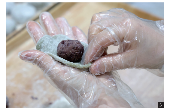
3. 국내산 통팥을 아낌없이 넣은 고라실찹쌀떡은 독특한 식감과 담백한 단맛으로 소비자들의 꾸준한 사랑을 받고 있다.