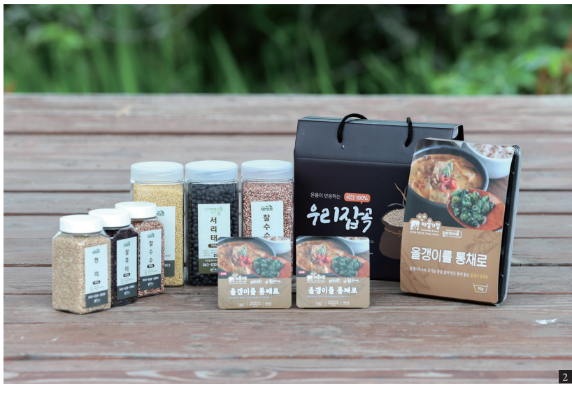
2. 괴산의 청정 자연이 길러낸 잡곡과 울갱이청국장을 비롯한 건강한 먹거리는 둔울울갱이영농조합법인의 가장 큰 경쟁력이자 자산이다.