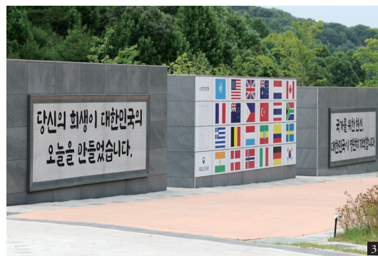
1. 대전, 국립대전현충원 2. 충남 예산, 윤봉길 의사 사적지 3. 충북 괴산, 국립괴산호국원